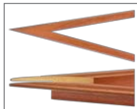
GLS pour la coupe d'angles entre -81^\circ et +81^\circ