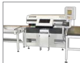
GLS-2: réglage des angles de coupe dans deux plans