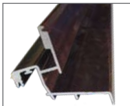
Profilé en aluminium pare pluie