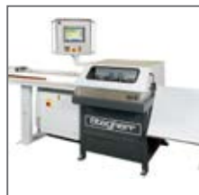
GLS avec butée à CN et évacuation pièces