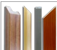
Matériaux: MDF, bois, aluminium, pvc

Le dispositif de commande ergonomique, très accessible à l'utilisateur, assure un grand confort en manuel ou online.