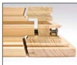
Assemblage à vis

Ce concept très flexible permet de réaliser des machines en exécutions diverses: Avec moteurs de 4,0 à 7,5 kW, avec des arbres de différentes longueurs et des porte-outils divers. Avec deux ou quatre broches, ajustages pneumatiques ou par servo-moteur, changeur d'outils, avec tronçonneuse simple ou avec une scie à commande numérique, pour ne citer que quelques variantes.