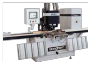
Fraisages pour ferrures avec la FD-E2