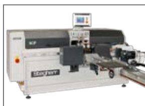
KF avec changeur outils automatique