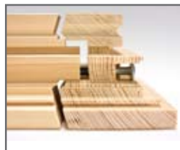
Угловое соединение с помощью шурупа

Гибкая комплектация Stegherr контрфрезерного станка тип KF делает возможным многочисленные модификации с вариантами моторов: от 4 до 7,5 кВт с различными длинами шпинделей и захватов - 2 или 4 подвижных шпинделя, магазин инструмента, с пневматической или с сервоприводом с пилой поезда или с ЧПУ автоматической пилой, чтобы называть только несколько вариантов.