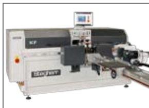
KF с магазином инструмента