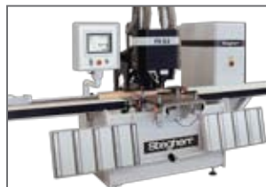
Фрезеровка петель и шарниров на станке FD-E2