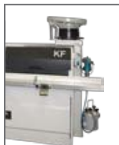
KF с модулем для сверления шканта