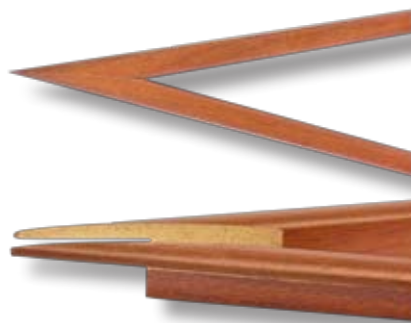
GLS en exécution spéciale pour angles de coupe de jusqu'à +/-81°

En fonction du type de machine, le réglage des différents angles de coupe et de la vitesse de montée de la lame est pneumatique, par vérins ou commandé par le programme et par servomoteur.