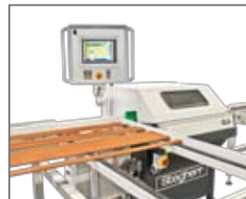
Profilleistensäge GLS: Sägewinkelverstellung bis +/- 81 Grad